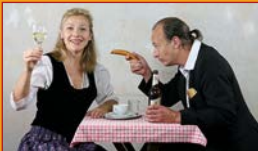
Berlin – Wien