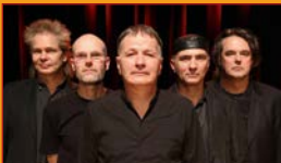
Thomas Rühmann & Band