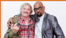
„Ein seltsames Paar“