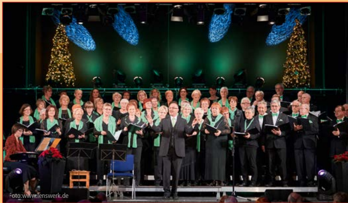
Einen stimmungsvollen Abend mit vielen Advents- und Weihnachtsliedern unter dem Motto „Alle Jahre: Fröhliche Weihnacht“ gab's mit dem Gemischten Chor der Polizei e.V. Der weit gereiste Chor gastierte bereits in den USA, in Kanada und ist europaweit unterwegs.