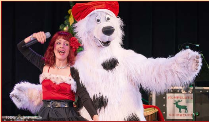
Die Taschenlampenkonzertband Rumpelstil hatte zum großen Weihnachtsliedersingen eingeladen und alle waren gekommen in den ausverkauften Arndt-Bause-Saal – Weihnachtsstimmung und viele rumpelstilistische Weihnachtslieder waren vorprogrammiert.