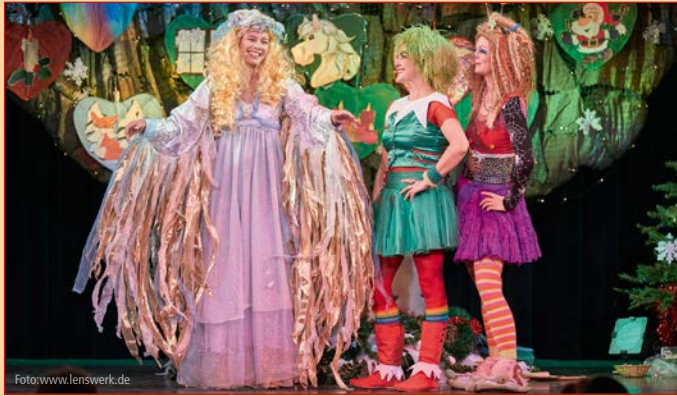
Die Traumzauberbaum-Bühnenshow mit dem Reinhard-Lakomy-Ensemble faszinierte auch dieses Jahr die Kinder samt Eltern und Großeltern. Gemeinsam mit Moosmutzel, Waldwüfel und Agga Knack suchten sie den Weihnachtsengel Helga Himmel.